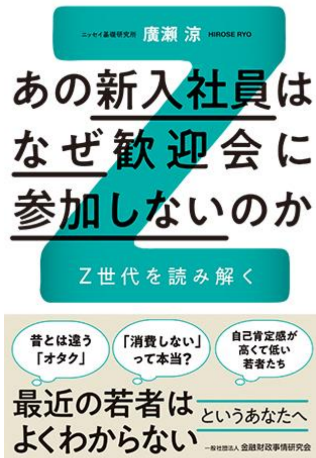
図2 『あの新入社員はなぜ歓迎会に参加しないのか: Z 世代を読み解く』

若者の消費文化を追ってきた筆者が Z 世代ならではの価値観、消費行動を深掘りし、彼らが何にプライオリティを置いているのか、なぜ歓迎会に参加したくないのか、論じている。今若者とのコミュニケーションに困っている方、今若者が何を考えているのか手探りをしている方、今すぐにでも若者の消費を促すヒントを欲している方には是非手に取っていただきたい。