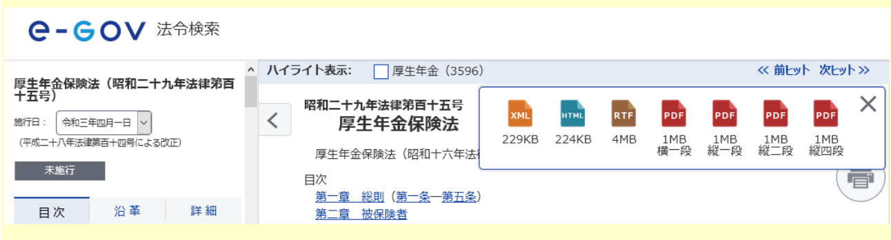
図表1 e-Gov法令検索の表示例

検索したところ、e-Govの改修は以前から計画されていたことが分かったが、同時に、最近の政府におけるデジタル改革の動きが話題になっていることを知った。特に話題になっているのは、 電子メールに電子ファイルを添付する際のパスワード付きZIPファイルとパスワード後送(いわゆるPPAP)の廃止 *2と、Excel形式の統計表におけるセル結合等の廃止のようだ。