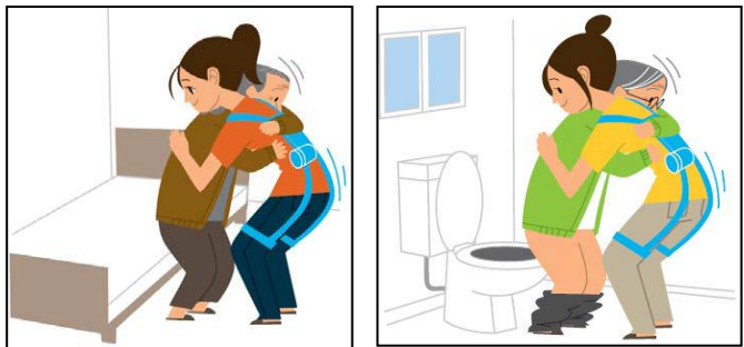
図表-3 重点分野のイメージ(移乗介助-装着型)

(資料)経済産業省製造産業局産業機械課「ロボット介護機器開発・導入促進事業(基準策定・評価事業)研究基本計画」(平成25年4月)の【別紙】より抜粋