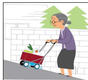
図表-7 重点分野のイメージ (移動支援)