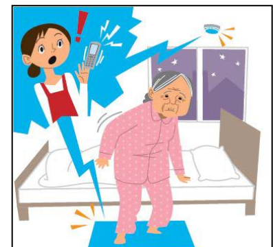
図表-11 重点分野のイメージ(認知症の方の見守り)