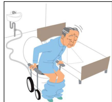
図表-9 重点分野のイメージ(排泄支援)