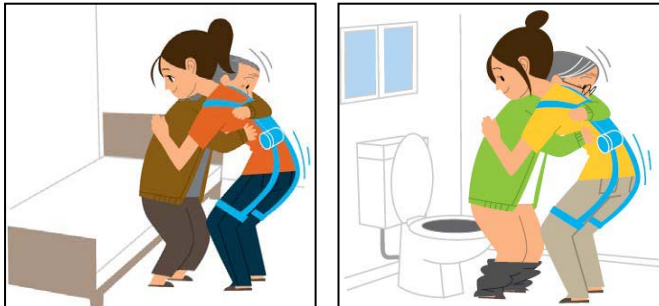
図表-3 重点分野のイメージ(移乗介助-装着型)