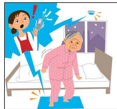
図表-11 重点分野のイメージ (認知症の方の見守り)