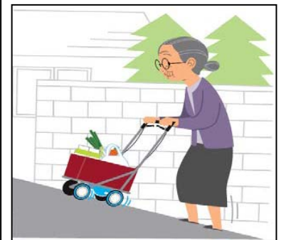
図表-7 重点分野のイメージ(移動支援)