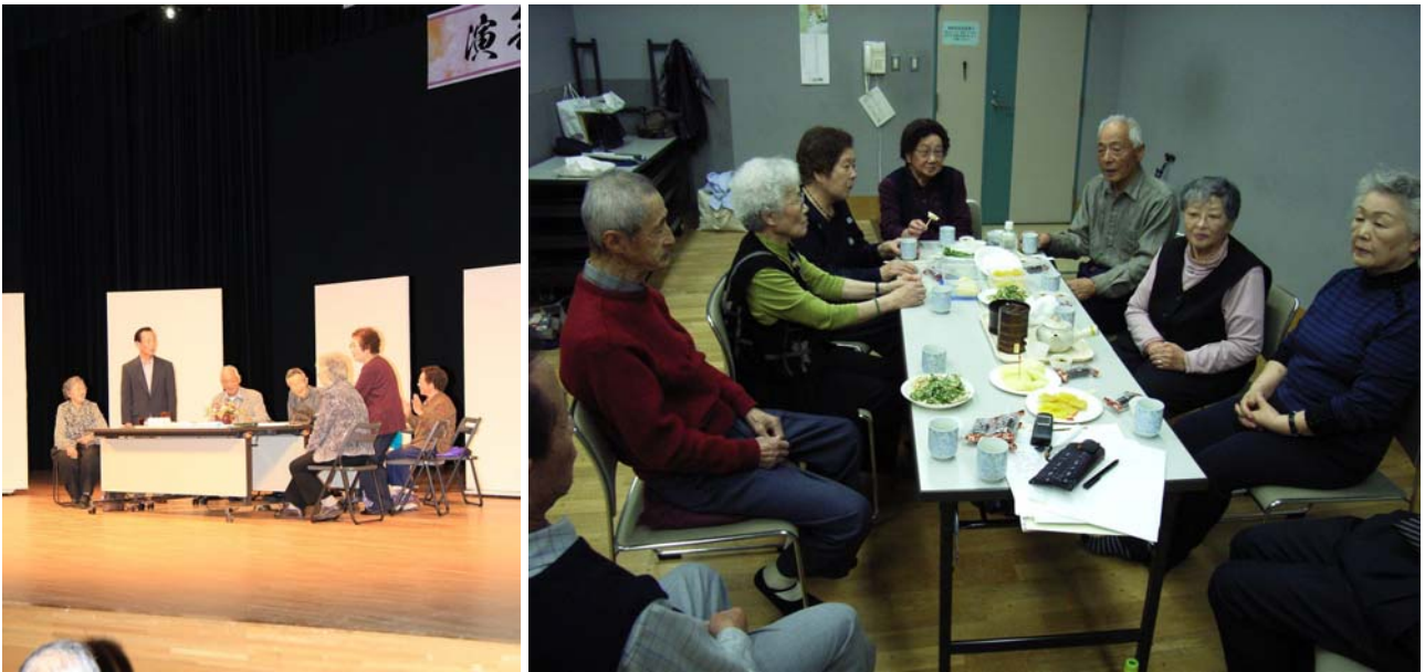
左：座・たくあんの舞台公演、右：稽古の後の歓談の様子