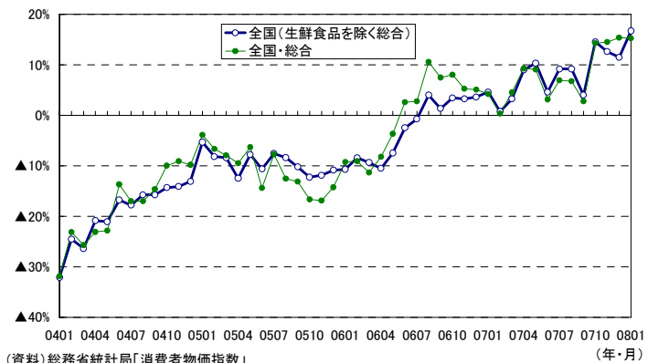
消費者物価・上昇品目数(割合)・下落品目数(割合)