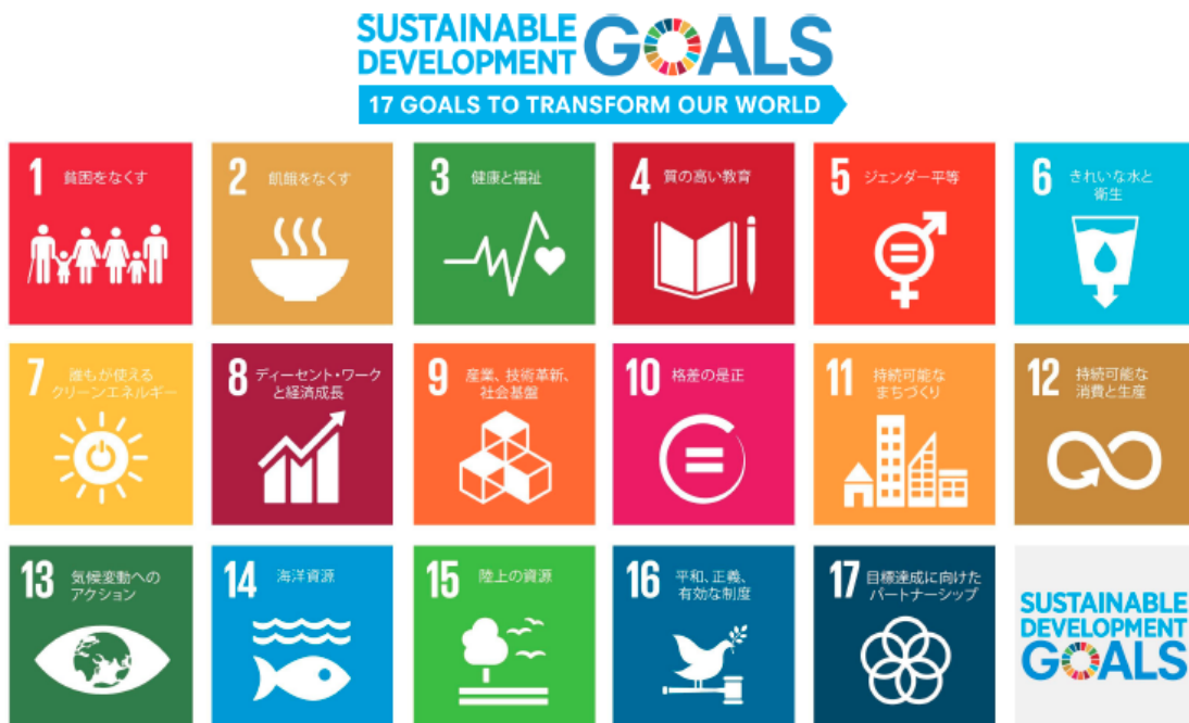
図表1 : 持続可能な開発目標 (SDGs) の17のゴール

2015年9月の国連総会にて、「持続可能な開発のための2030アジェンダ」が採択された。2030アジェンダでは、17のゴール169のターゲットから構成される、持続可能な開発目標(Sustainable Development Goals; SDGs)が含まれている(図表1)。SDGsは2000年に採択されたMDGsの後を継ぐ形で公表されている。MDGs(Millennium Development Goals)が、先進国によると途上国支援という色彩が強く、企業の関与も限定的に記述されているにとどまっていたのに対して、SDGsでは、先進国と途上国がともに達成すべき目標であり、企業により積極的な貢献を求めている点が大きく異なるポイントである。