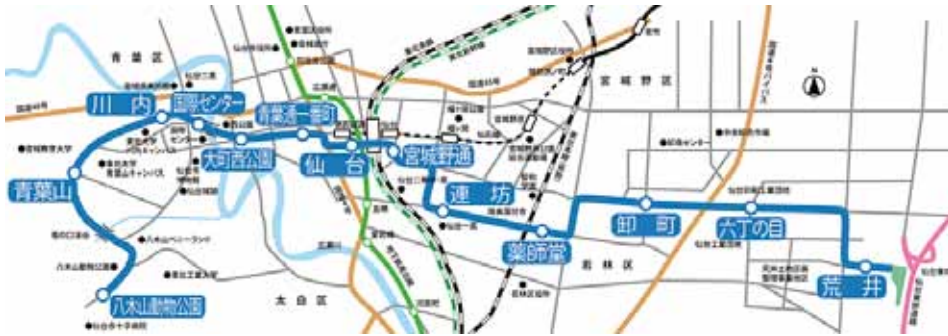
[図表1] 地下鉄東西線の路線図

議の会場となる。既存施設の利用状況や採算性から新設には賛否があったようだが、仙台市では今後国際会議を誘致していく方針を示している。