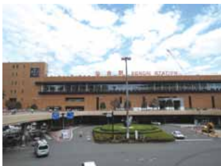
[写真1] JR仙台駅西口のペDESTリアンデッキと東口開発工事

青葉通りを西に進み仙台城址方面に向かって広瀬川を渡ると仙台市博物館が所在する文化エリアで、ここには「国際センター駅」が開業する予定だ。国際センターは大ホールやレセプション会場を備えた既存の施設だが、現在これに隣接した新展示施設を建設中で[図表2]、竣工後の2015年3月に開催される国連防災世界会