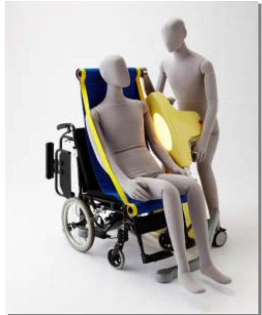
図表-2-③ 移乗システム ROBOHELPER SASUKE の外観

機器本体はシートの上下にアームを通して抱え上げるため、非常にコンパクトであり、利用者も機器に対しての威圧感を感じないであろう。