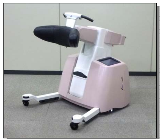
図表-2-② 移乗介助用サポートロボットの外観

保持部(写真の黒い部分)を多軸アームの先端に設け、人の自然な動作軌跡を再現しながら抱え上げ動作を行う。介助者は上部についている逆向きのハンドル&タッチセンサーを操作し、縦の支柱を伸縮させて、利用者の起立・着座を支援する。足の残存能力を引き出すためのトレーニングモードも備えている。安全性の確保と利用者の状態の検知のために、複数箇所に衝突防止センサーや膝やつま先を検知するセンサーなどが組み込まれている。歩行器や搭乗モビリティとしても使用できる多機能ロボットである。