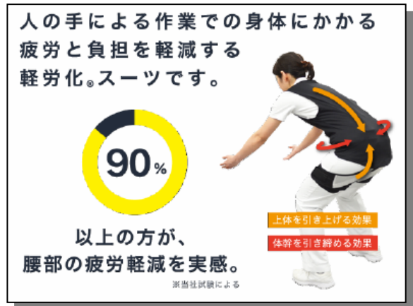
図表-2-① 「スマートスーツ ® EX」の外観