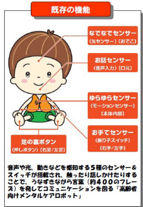
図表-2-⑥ 既存の「うなずきかぼちゃん」

なお、ネットワークロボットとは、各種センサや機器類をネットワークで結び付け、協調して運用することで、単独のロボットでは実現できない事柄を実現するロボットを指す。つまり、住宅1軒全体があたかも1つのロボットのように、住む人の見守りなどを行い、その各種情報や全体機能を統括する役割を新しい「かぼちゃん」が担うということである。今後の「見守りかぼちゃん」の開発に期待したい。