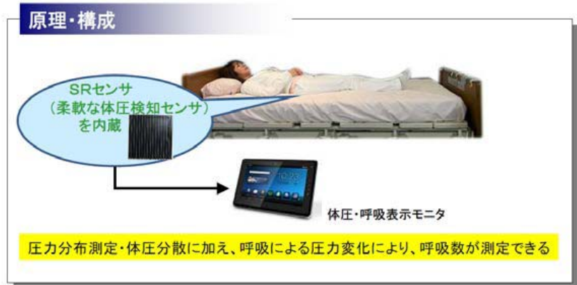
図表-2-⑦ 見守りプラットフォームの概要

同社が開発中の見守りプラットフォームは、基本技術に、自社開発のスマートラバー (SR) センサという、全てゴムでできた柔軟で薄い厚みのシート状の圧力センサを応用している。このシートは大面積にしやすく、これをベッドに敷くことによって、認知症の方や様々な要介護者の姿勢・体