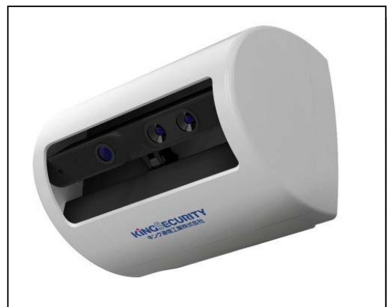
図表-2-⑧ (仮称) シルエット見守りセンサ

また3Dのシルエット画像 (モノクロの階調表示) を採用することにより、対象者のプライバシーに配慮している。壁に直接取り付け、Wi-Fi で外部のPCやスマートフォン、タブレットなど様々な端末で確認ができる点も特徴である。このほか、センサ検知前後の合計15秒の