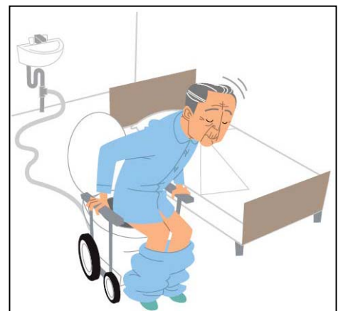
図表-2-④ 排泄支援介護ロボットのイメージ(経済産業省)

現在、同社が開発中の機器は、配管のない居室で水洗便器を利用可能とするため、便器本体に粉碎圧送ユニット(汚物や紙を細かく粉碎し、液状にして圧力を掛けて送り出す装置)を取り付け、細い柔軟なパイプを使って屋外の汚水枦へ流すことが可能なシステムとなっている。圧送により勾配がなくても、柔軟なパイプで室外へ排水でき、大掛かりな排水工事が不要で、壁に小さな穴を開けることで使用できるため、施設や在宅においてメリットが大きいと思われ、今後の開発が大いに注目される機器である。