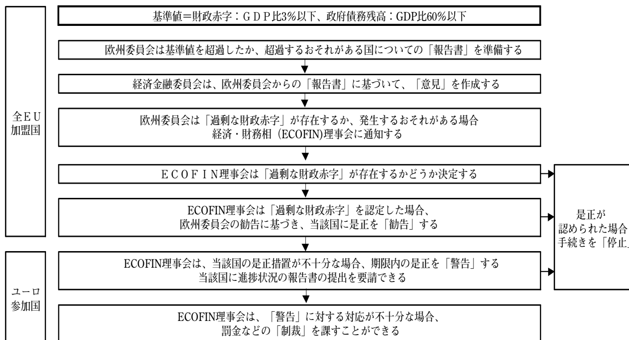
〔図表-4〕 EUの過剰な財政赤字是正の手続き

結局、ギリシャへの不安の拡大に対応した2010年2月がECOFIN理事会がギリシャに「警告」の関する条項に基づいてマクロ経済政策も含めた是正を要求した初めてのケースとなった。しかし、この段階に至っては、ギリシャへの信認回復にはつながらず、財政と経常収支の大幅な双子の赤字、ユーロ導入後の競争力低下という問題を共有するスペイン、ポルトガル、アイルランドの財政に対する不安の拡大に歯止めをかけることもできなかった。