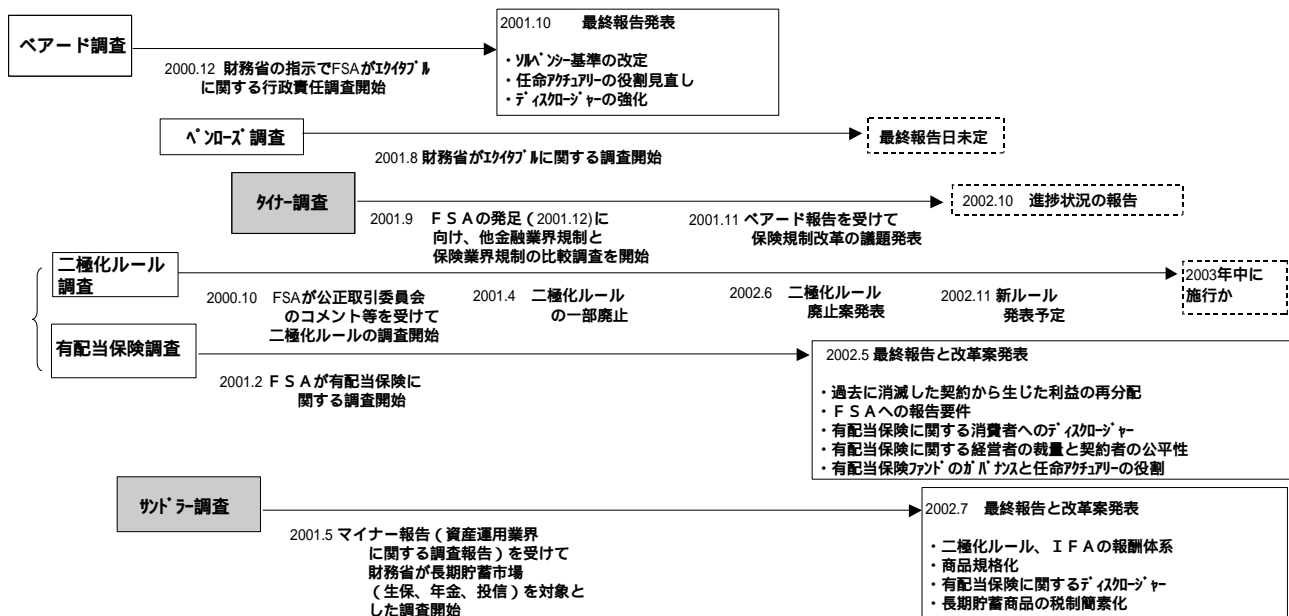
図表-1 英生保業界の規制改革の概要

財務省は個別の金融機関の監督権限はFSAに委譲したものの、FSAのボードメンバーの任命権や、FSAの監督効率性や監督責任を調査する権限等は保持しており、財務省とFSAは、それぞれに生保業界の改革プロジェクトをいくつも立ち上げている（図表-1）。